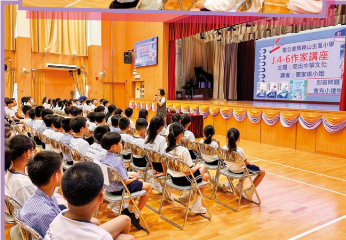
「吃出中華文化」的主題與生活息息相關，學生都感興趣。