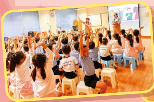
活動中，有互動環節，同學們都很想和小丑交流呢！