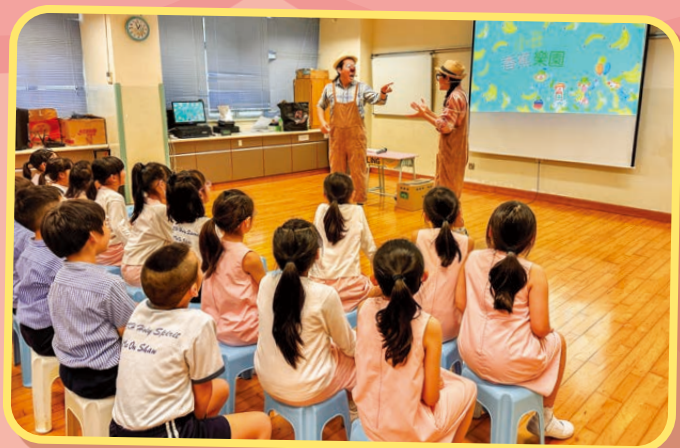
「班班你是最好的」是講述一隻小香蕉也有責任感的短篇故事。

圖書組邀請外間機構的演出者，為一至三年級學生帶來了一場以「責任感」為主題的精彩演出。透過小丑劇場及互動環節，演出者向學生講述每個人和每個崗位都承擔着獨特的責任，讓學生以趣味的方式明白盡責的重要性。學生均表示十分喜歡小丑的演繹，在活動過程中表現投入，並提升了對「責任」在個人成長的認知。