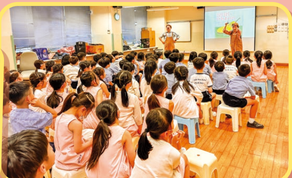
小丑以輕鬆有趣的手法說故事，學生都十分投入呢！